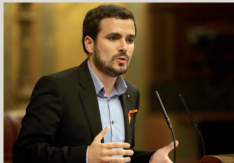
Garzón calificó a Rajoy de ser un "cuentacuentos". F. MORENO

El diputado de IU además, acusó al presidente de "torturar" las estadísticas dicien-