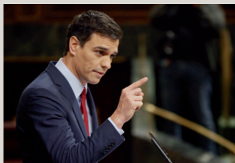
Sánchez acusó a Rajoy de causar un "destrozo descomunal".