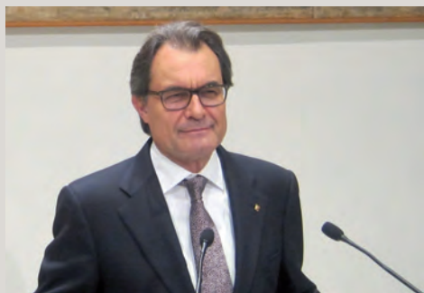
El Constitucional también ilegaliza la Ley de Consultas.

Criticamos a los islamistas por meter la religión en el Estado, y en los colegios españoles vamos a volver a ver a niños rezando en las aulas