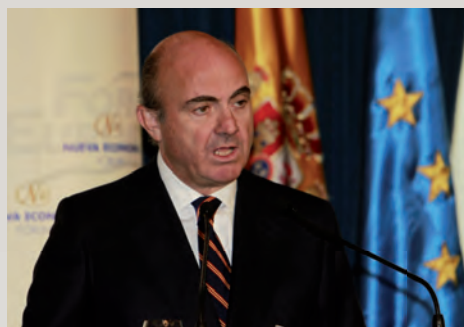
De Guindos ha afirmado que el PIB “va en aceleración”.

El secretario de Estado de Economía, Íñigo Fernández de Mesa, señaló 2014 como el “primer año de crecimiento desde el comienzo de la crisis”, mientras el ministro de Economía, Luis de Guindos, más prudente afirmaba que el alza del PIB supone un crecimiento económico moderado pero “en aceleración” y subrayaba que la estimación del 2,4% para 2015 es “prudente” ya que la cifra definitiva se conocerá en abril. Además, De Guindos ha anunciado que no continuará como ministro o diputado tras las generales.