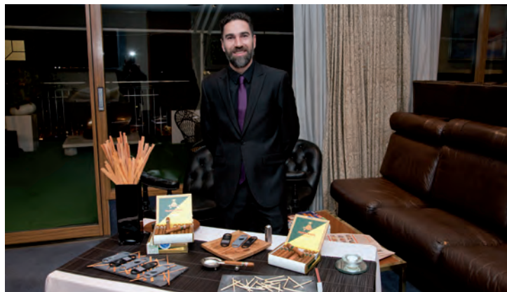
Stand de degustación de puros Montecristo Open Junior.