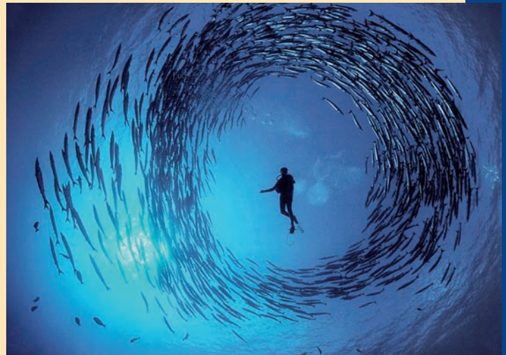
'Circling barracuda', de David Doubilet.

A Coruña presenta del 24 de septiembre y el 29 de noviembre la II edición del Festival Mar de Mares, un encuentro internacional sobre arte, ciencia y sostenibilidad que gira en torno al mundo marino y que quiere festejar la importancia de los océanos como fuente de riqueza y recurso natural imprescindible. El festival incluye exposiciones, encuentros, charlas, debates, gastronomía y talleres, y contará, entre otras muchas actividades, con colectivos artísticos como Ba-