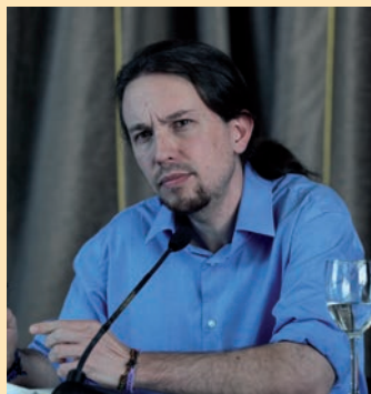
Iglesias no resucita a 'Un tiempo nuevo'.

Pablo Iglesias mareó la perdz durante meses y meses antes de sentarse en Un tiempo nuevo (ahora en Cuatro) y lo hizo en una edición en la que también aparecía Ana Rosa Quintana contando las vicisitudes de su rodaje con el líder de Podemos, más Alberto Garzón, candidato de IU. El resultado fue nefasto en audiencia, un escueto 3,5% de share que cae de lleno en el ridículo, frente al 17,2% de Sálvame de Luxe , lo que cuestiona gravemente el futuro del espacio de Mediaset, al que sólo salva el interés de Vasile por tener ventanas con las que jugar en estos meses tan decisivos políticamente y en los que Rajoy decide la adjudicación de licencias para la TDT. Por si fuera poco, en La Sexta Noche estaban García-Margallo y Albert Rivera, que obtuvieron un 7,1 de share . Tanto hacerse de rogar Iglesias para..., casi nada. Pocas horas después, Ana Pastor logró un 10,1% en su entrevista a Mas en El objetivo .