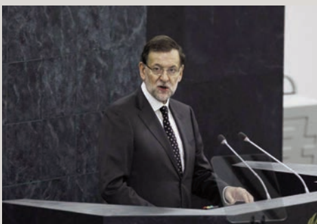
Mariano Rajoy, presidente del Gobierno.

En España, el presidente del Gobierno, Mariano Rajoy, ha mantenido contactos con