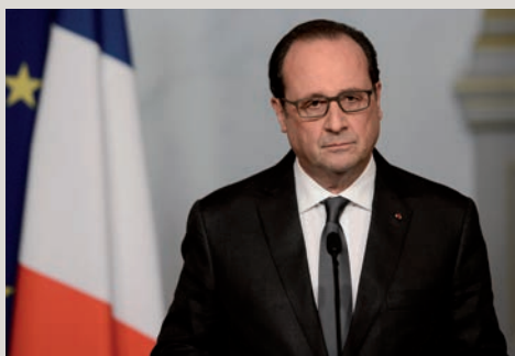
François Hollande, presidente de la República de Francia.