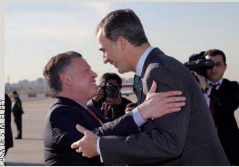
Felipe VI recibió a Abdalá II en Barajas.

A su llegada, los monarcas jordanos fueron recibidos por Felipe VI y Doña Letizia en el Pabellón de Estado del Aeropuerto Adolfo Suárez Madrid-Barajas. Abdalá II realiza una gira por Europa para llegar a un acuerdo en materia de cooperación en Defensa y ciencia. Este viaje de Estado llega en un momento de alta tensión internacional después de la sucesión de atentados ocurridos en París el 13-N y la difícil situación de algunos países en Oriente Próximo. Además, el soberano jordano se reunió en el Palacio de la Moncloa con Mariano Rajoy y asistió con Don Juan Carlos y Doña Sofía a una cena de gala en el Palacio de El Pardo. Abdalá II también visitó las instalaciones de Airbus Defense & Space situadas en Getafe.