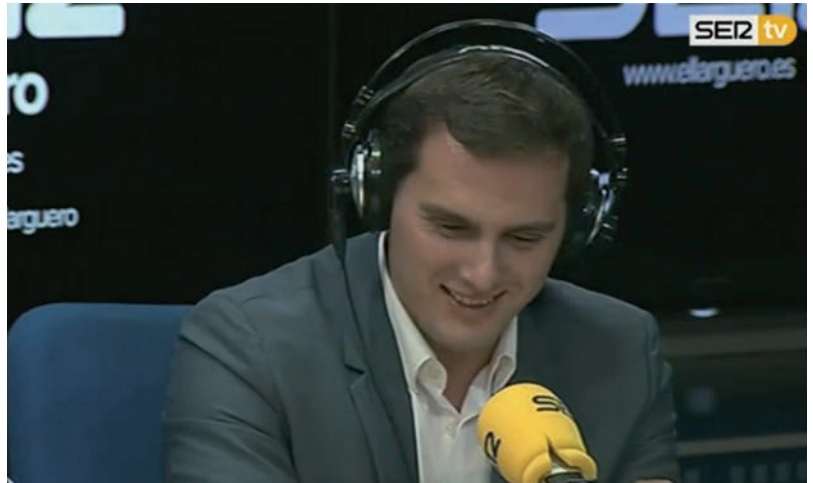
Vicente del Bosque ha ubicado al candidato de Ciudadanos en el terreno político-futbolístico.