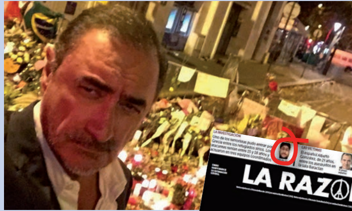
Herrera demostrando que él estuvo allí y la portada 'patinazo' de 'La Razón'.

Carlos Herrera no quiso ser menos en el desfile de avezados reporteros y se desplazó hasta la capital francesa, incluso hasta la misma puerta de la sala Bataclan, como quedó demostrado con el selfie que se sacó en la zona cero de los atentados. Una foto que ha provocado la hilaridad en Twitter con todo tipo de montajes: Herrera con