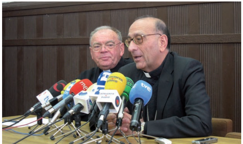
Los prelados catalanes querían para Barcelona un arzobispo catalán pero el Papa ha nombrado a Omella.

Vicente del Bosque sabe jugar y es lo que hizo la semana pasada en el programa El Larguero, de la cadena Ser, cuando volvió a intervenir en las entrevistas de José Ramón de la Morena a los candidatos del 20-D, esta vez a Albert Rivera. A la pregunta de en qué posición del campo jugaría el líder de Ciudadanos contestó: "Lo pondría de interior derecha, de extremo no". Y por si no había quedado claro el paralelismo político, cuando le compararon con el barcelonista Leo Messi dijo el seleccionador nacional; "no, pero también sabe driblar".