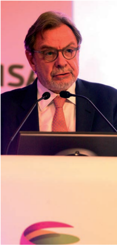
Juan Luis Cebrián, factórum de Prisa.