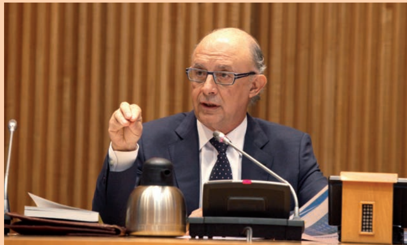
Cristóbal Montoro estaría estudiando hacerla pública en la campaña.