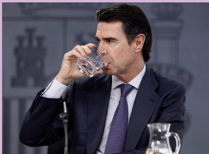
El ministro de Industria plantearía efectuarla en plena campaña.

Según indicó Soria en declaraciones a la prensa en un seminario celebrado en la Fundación Ra-