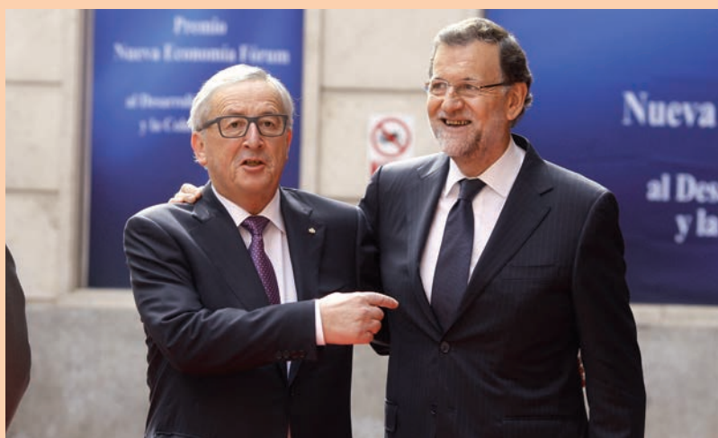
El presidente de la Comisión, Jean-Claude Juncker, junto a Rajoy.

Soria recordó que el superávit de 2014 será el primero desde 2000, después de que entre 2000 y 2004 el sistema arrojase un déficit promedio de 400 millones al año, frente a los 1.900 millones del periodo entre 2004 y 2008.