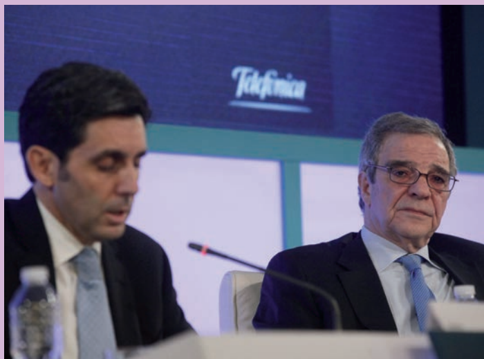
Alierta (dcha.), presidente de la compañía, y su consejero delegado, Álvarez-Pallete.

Telefónica tendrá la obligación de abrir su red de fibra óptica a los competidores salvo en 34 ciudades, según el proyecto de regulación aprobado el pasado miércoles por la Comisión Nacional de los Mercados y la Competencia (CNMC) y que todavía debe recibir el visto de Bruselas. Desde el regulador se defiende que la norma supone aumentar de 9 a 34 las ciudades en las que el operador "con poder significativo de mercado", que en la mayoría de las ocasiones es Telefónica, podrá